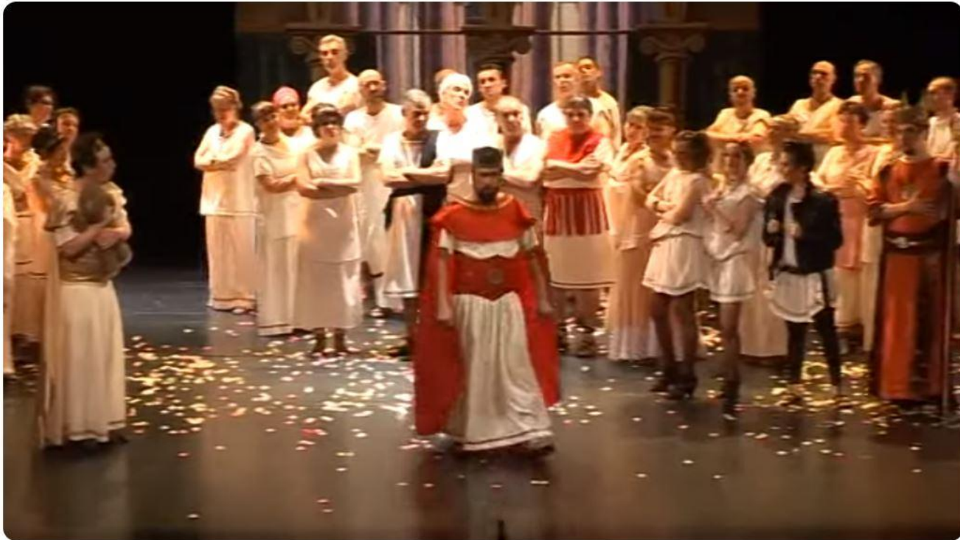
Couplets des rois : Belle Hélène d'Offenbach - Grand Théâtre d'Angers

https://www.youtube.com/watch?v=N5xUzgZHw0c